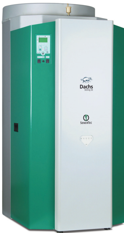
Dachs Stirling SE

Fossile Brennstoffe sind zu kostbar, um sie nur einfach zu nutzen. Zeitgemäße Heizungssysteme erzeugen daher nach dem Prinzip der Kraft-Wärme-Kopplung (KWK) nicht nur Wärme, sondern auch Strom. Mit einer thermischen Leistung von 6,1 kW und einer elektrischen Leistung von bis zu 1 kW eignet sich der Dachs Stirling SE ideal für die Energieversorgung von Einfamilienhäusern mit geringem Wärmebedarf. Zeitweise anfallende Bedarfsspitzen an Wärme deckt ein zusätzlicher, im Gerät integrierter 18-kW-Brenner ab. Der erzeugte Strom wird im Haus genutzt und der Stromüberschuss gegen eine Einspeisevergütung in das öffentliche Versorgungsnetz eingespeist.